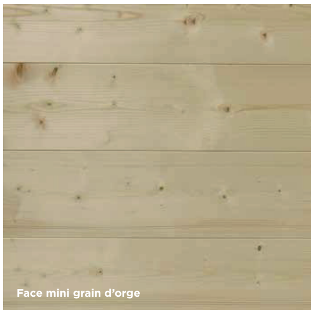
Face mini grain d'orge