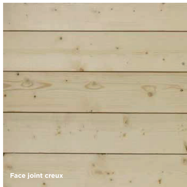
Face joint creux

Ce parement présente la particularité d'être réversible et par conséquent de proposer deux faces visibles. Avec deux aspects de surface différents (scié fin et raboté) et deux profils bien distincts (joint creux et mini grain d'orge), ce parement se veut universel.